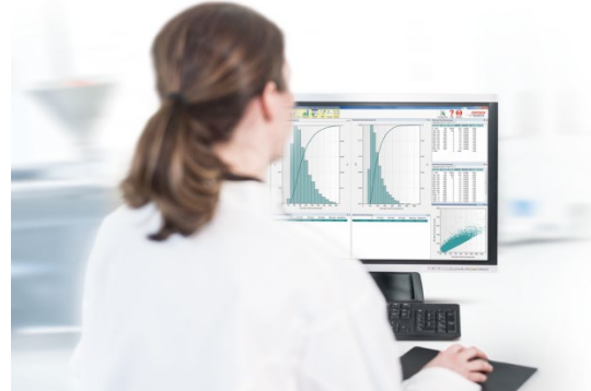
Abb. 1: ANALYSETTE 28 ImageSizer zur Messung von Partikelform und -größe im weiten Messbereich von 5 \mu\text{m} – 20 mm

Das zugrunde liegende Messprinzip ist schnell erklärt: Ein Strom von Partikeln wird vor einem großflächigen LED-Blitz vorbeigeführt und die Partikel dabei im Gegenlicht von einer Digitalkamera in schneller Folge fotografiert. Der optische Aufbau ist also vergleichbar mit der Durchlicht-Mikroskopie, man erhält einen hohen Kontrast zwischen dem homogen ausgeleuchteten, hellen Hintergrund und den Licht abschattenden Partikeln. Sämtliche Bilder werden dann von einer Software analysiert und die jeweils ausgewählten Daten nach Abschluss der Messung angezeigt. Doch dazu später mehr.