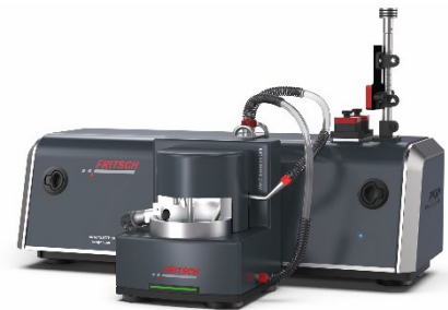
Abb. 4: ANALYSETTE 28 ImageSizer zur Nass-Messung von Partikelform und -größe von Suspensionen und Emulsionen

Bei der Nass-Messung ist eine gute Probenteilung meist sogar noch wichtiger als bei der Trocken-Messung. Ein geschlossener Flüssigkeitskreislauf mit einem variablen Flüssigkeitsvolumen zwischen 150 ml und 500 ml wird hierbei kontinuierlich durch eine Messzelle gepumpt, die benötigte Probenmenge ist daher meist deutlich geringer als bei der Trocken-Messung. Bei der Nass-Messung wird natürlich die obere Messgrenze durch die Geometrie der Messzelle bestimmt. Mit der Nass-Dispergiereinheit der ANALYSETTE 28 ImageSizer lassen sich Partikel von ca. 5 µm bis etwa 3 mm vermessen.