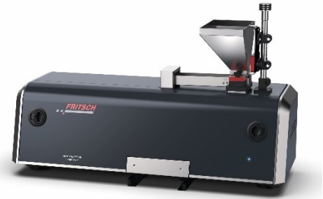
Abb. 3: ANALYSETTE 28 ImageSizer zur Trocken-Messung von Partikelform und -größe Pulvern und Schüttgütern

Bei einer Trocken-Messung wird das Probenmaterial über einen Trichter und eine Vibrations-Zuteilrinne kontinuierlich der Messung zugeführt, wobei sich die Probenvorschub-geschwindigkeit – also wieviel Material pro Minute gefördert werden kann – nur in engen Grenzen erhöhen lässt: Die Überlagerung zweier Partikelbilder, die zufällig auf der gleichen Sichtlinie an der Kamera vorbei fallen, soll so gering wie möglich gehalten werden. Bei diesem Verfahren steht jedes Probenpartikel nur einmal der Analyse zur Verfügung, und es sollte speziell bei Proben mit einer weiten Partikelgrößenspanne möglichst immer die gesamte in das Fördersystem eingegebene Probenmenge abgearbeitet werden, um eine Beeinflussung des Ergebnisses durch eventuelle Segregationstendenzen zu vermeiden. Mit der Trocken-Messung lassen sich Partikel von ca. 20 µm bis etwa 20 mm vermessen.