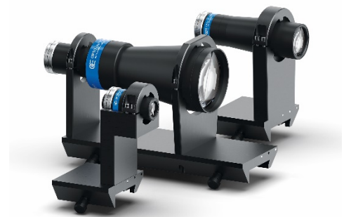
Abb. 2: verschiedene telezentrische Objektive unterschiedliche Messbereiche

Wie erkennt nun das Gerät Partikel? Vereinfacht gesagt erkennt die Software dunkle Bildbereiche als Partikel und helle als Hintergrund. Aber natürlich gibt es zwischen Hell und Dunkel zahlreiche Abstufungen: Die Anzahl der verfügbaren Graustufen der Kamera beträgt 2^8 = 256 (d.h. der Dynamikumfang der Kamera beträgt 8 Bit). Vollständiges Weiß entspricht einem Wert von 255, Schwarz ist 0. In der Software wird nun eine Schwelle angegeben, die entscheidet, ob ein Pixel zum Hintergrund oder zu einem Partikel gehört. Für sehr spezielle Probensysteme, wie beispielweise transparente Glasperlen, lässt sich diese Schwelle leicht individuell anpassen.