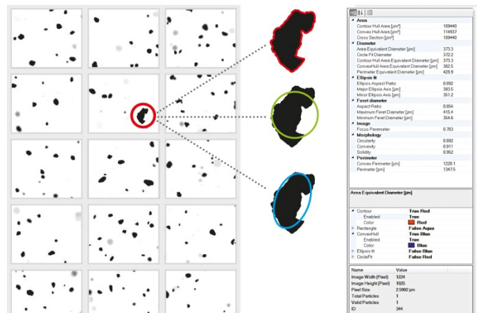
Abb. 7: Einzelbildanalysen aus der Bildergalerie

Autor: Dr. Günther Crolly, Produkt-Manager Partikelmessgeräte, Fritsch GmbH • Mahlen und Messen, E-Mail: crolly@fritsch.de , Tel. 06784 70 138