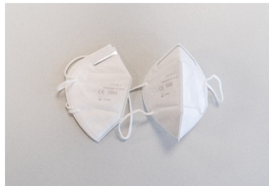
Abb. 2: FFP 2 Schutzmasken