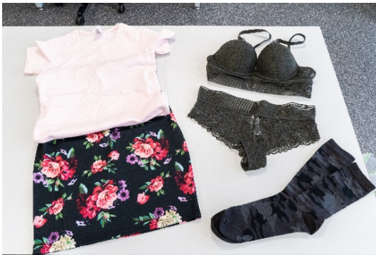
Abb. 1: Probenmaterial Textilien

Die Aufgabe bestand darin, Textilien und FFP2 Schutzmasken mit der PULVERISETTE 19 zu zerkleinern. Im ersten Arbeitsschritt wurden die Textilien manuell auf eine Größe von ca. 7 x 8 cm vorzerkleinert.