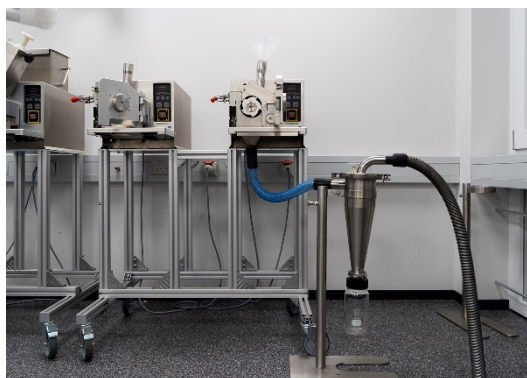
Abb. 3: PULVERISETTE 19 mit Hochleistungszyklon

Die PULVERISETTE 19 wurde mit dem Standardrotor mit V-Schneiden aus gehärtetem rostfreiem Stahl, sowie einer Siebkassette mit 2 mm Quadratloch ausgerüstet. Um einen besseren Durchsatz zu erzielen, wurde der Hochleistungszyklon aus Edelstahl angeschlossen. Die Textilmuster wurden in weniger als einer Minute zerkleinert. Für die größeren Textilteile (Rock und T-Shirt) wurde etwa 2 Minuten benötigt, für einen Ertrag von 105 Gramm Mahlgut. Es ist zu beachten, dass das Volumen des Mahlgutes ca. 30% höher ist, als des ursprünglichen Probenmusters, aufgrund der Strukturveränderung der Partikel. Der Rückstand in der Mahlkammer betrug 5 – 10 % Probenmaterial.