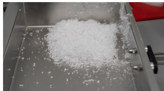
Abb. 6: Gemahlene FFP 2 Schutzmasken