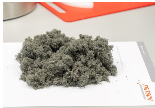
Abb. 4: Mahlprobe Textilien